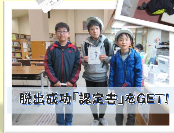
脱出成功「認定書」をGET!