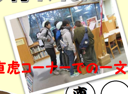
直虎コーナーでの一文字