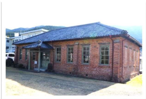
旧王子製紙気田工場 赤レンガ事務所 (天竜区春野町気田)