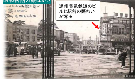
『浜松名勝 近代的建築物の立並び車馬輻輳（しゃばふくそう）して狂奏を織る浜松駅前』（昭和15年頃）