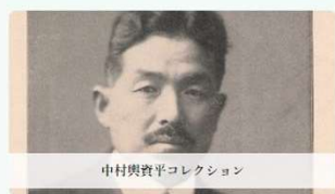
中村興資平コレクション