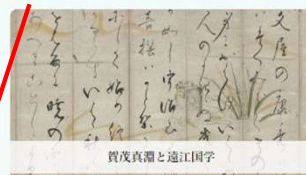
賀茂真淵と遠江国字